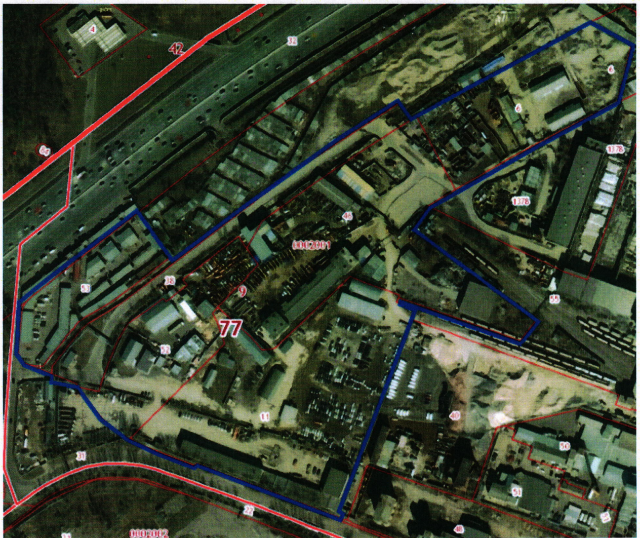
Схема границ части территории производственной зоны № 46 «Коровино» (промышленная зона № 46-I), в отношении которой принято решение о комплексном развитии территории по инициативе Правительства Москвы